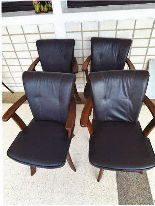
ชุดโต๊ะพร้อมเก้าอี้ ๒ ที่นั่ง