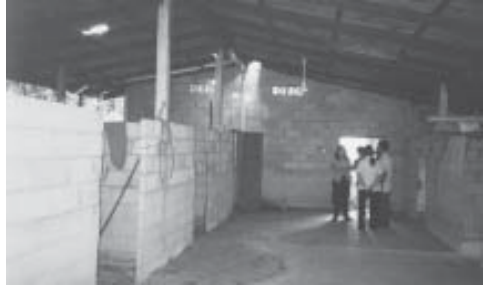
ภาพที่ ๑๐ : เรือนผู้ป่วยที่ชาวบ้านร่วมใจกันสร้างให้ (ปัจจุบันไม่ได้ใช้แล้ว)

แต่หมอกคงบอกไม่ได้ว่า เป็นเนื้อเยื่ออะไรที่ไหลออกมาทางน้ำลาย จะมีกลิ่นเหม็นมาก ปริมาณยาที่ผู้ป่วยกินมานั้นก็แล้วแต่ว่า บางรายก็กินมามาก บางคนก็กินมาน้อย วิธีการรักษาเริ่มแรกก็จับชีพจรดูก่อน ว่า ผู้ป่วยมีอาการขนาดไหน