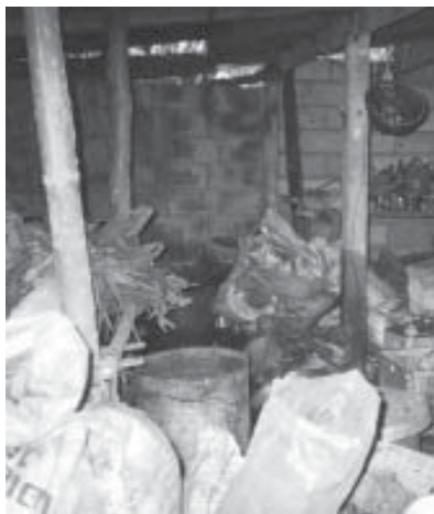
ภาพที่ ๕ : ห้องเก็บสมุนไพรแห้ง