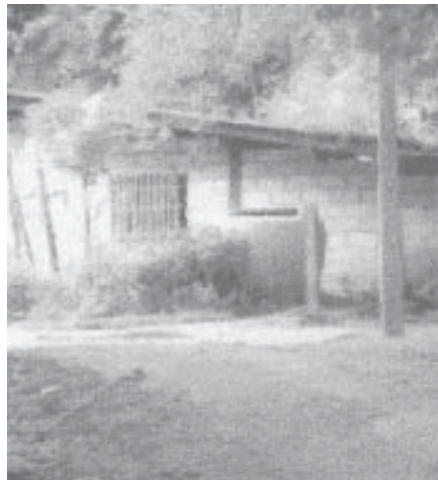
ภาพที่ ๔ : บ้านหมอคง

ปัจจุบัน สภาพร่างกายของหมอคงไม่ค่อยแข็งแรง เนื่องจากเป็นโรคถุงลมโป่งพอง เคยไปนอนพักรักษาตัวที่โรงพยาบาลเขาตึกฉัตร มีอาการเหนื่อยง่าย แต่ก็ยังมีคนมาขอให้หมอช่วยรักษาอยู่ทุกวันๆ ละประมาณ ๑๕ - ๒๐ คน