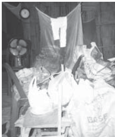
ภาพที่ ๖ : ที่นอนของหมอคง