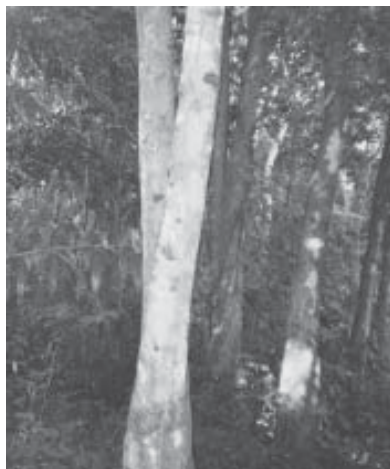
ภาพที่ ๘ : ป่าสมุนไพรของหมอคง