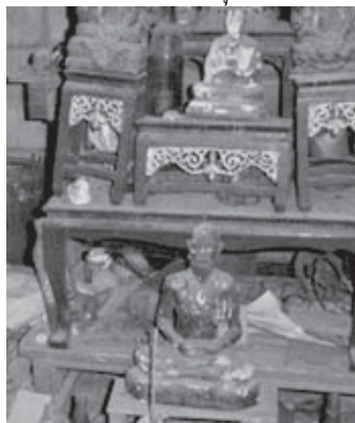
ภาพที่ ๗ : แท่นพระบูชาและ รูปชีวกโกมารภัก